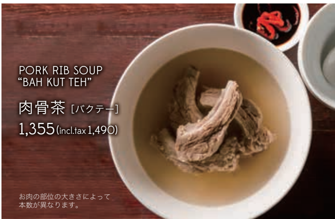
PORK RIB SOUP “BAH KUT TEH”