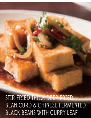
STIR-FRIED THICK DEEP-FRIED BEAN CURD & CHINESE FERMENTED BLACK BEANS WITH CURRY LEAF

STEAMED CHINESE BROCCOLI WITH OYSTER SAUCE