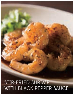
STIR-FRIED SHRIMP WITH BLACK PEPPER SAUCE