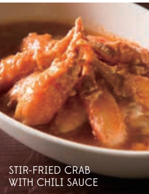
STIR-FRIED CRAB WITH CHILI SAUCE