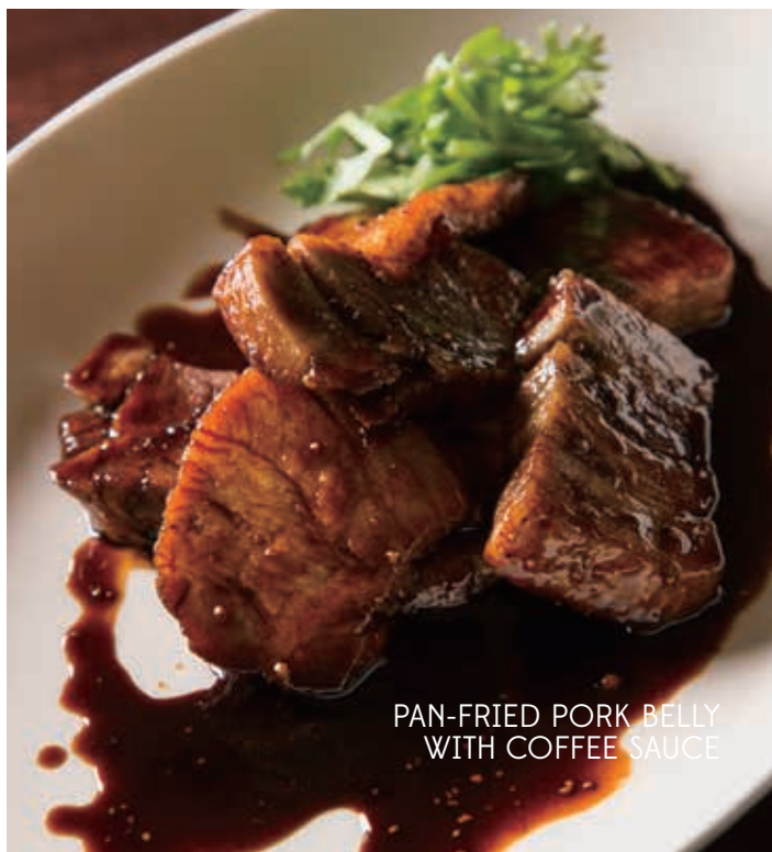
PAN-FRIED PORK BELLY WITH COFFEE SAUCE