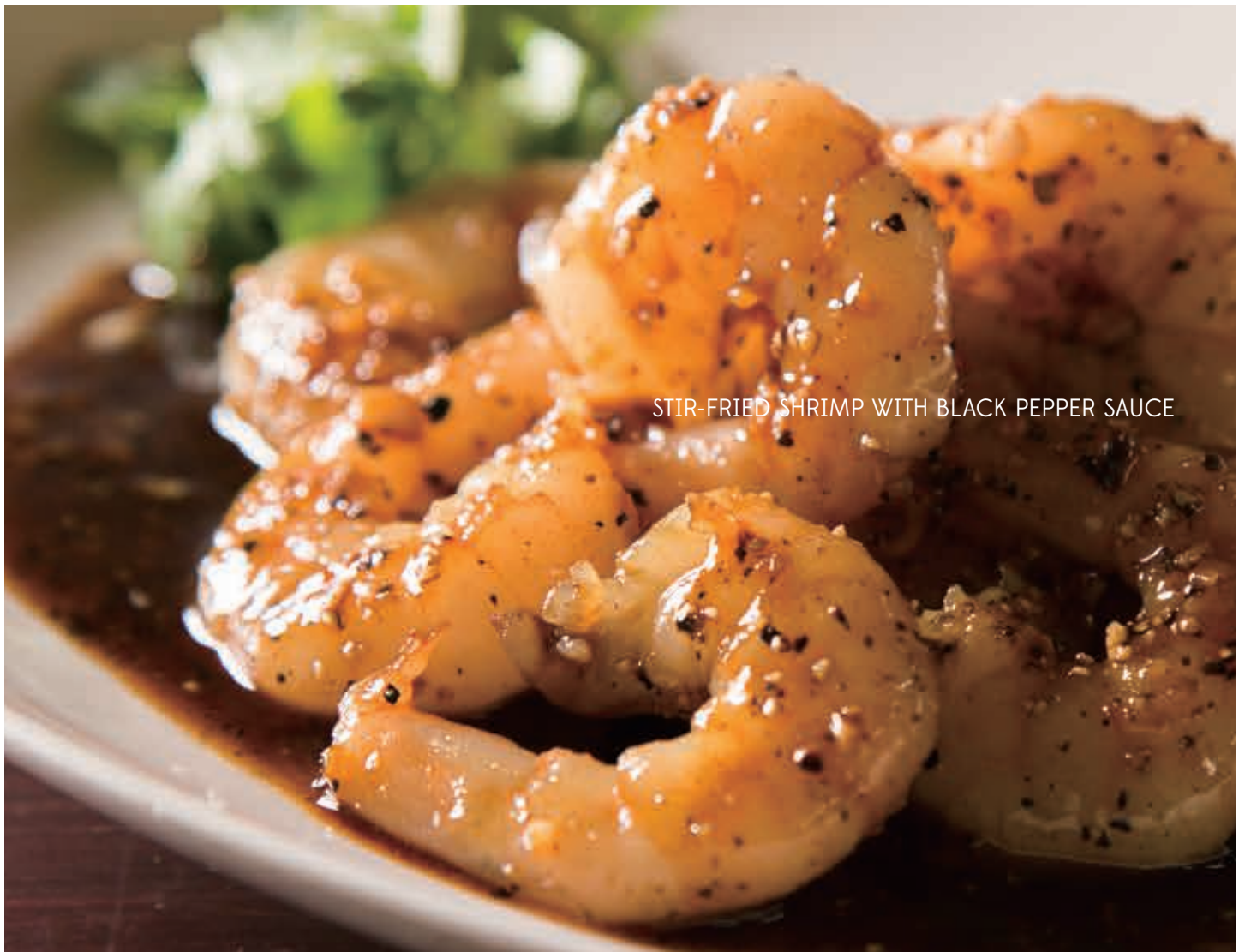
STIR-FRIED SHRIMP WITH BLACK PEPPER SAUCE