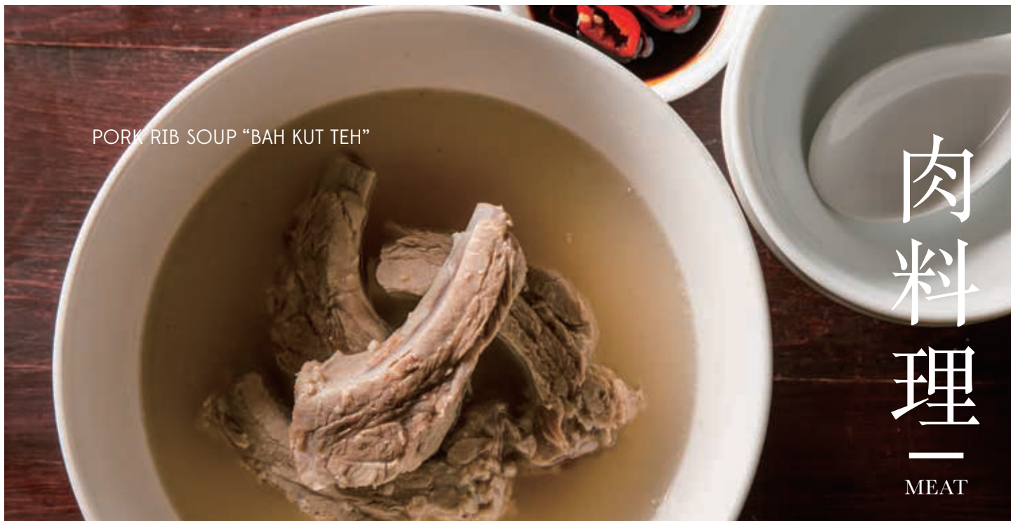
PORK RIB SOUP "BAH KUT TEH"