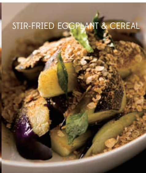
STIR-FRIED EGGPLANT & CEREAL