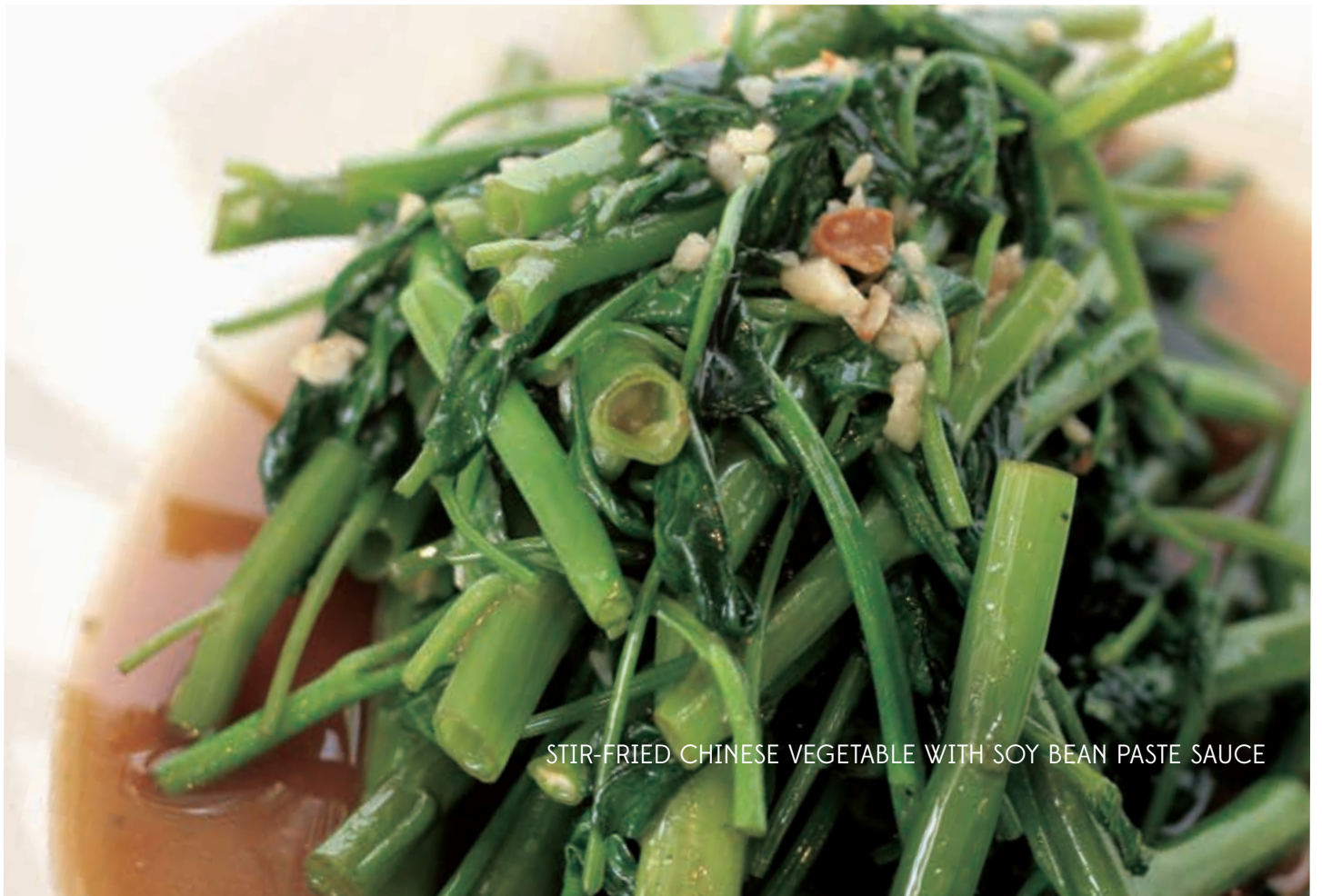
STIR-FRIED CHINESE VEGETABLE WITH SOY BEAN PASTE SAUCE