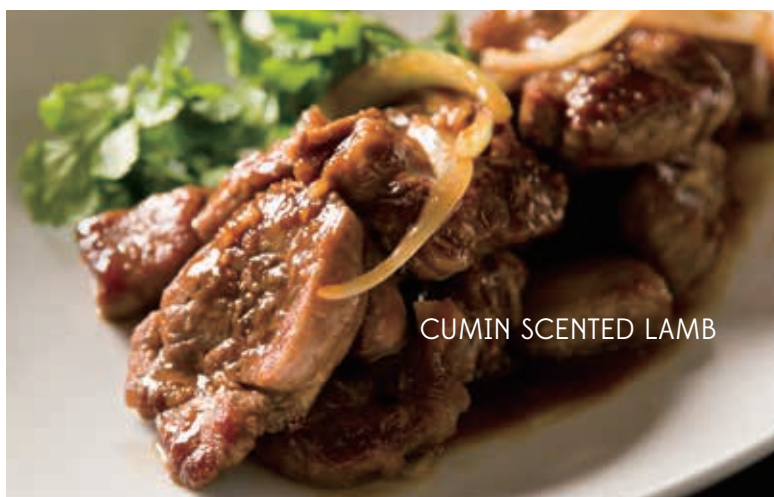
CUMIN SCENTED LAMB

ラムロースをバター醤油で薫り高くこっくりと炒めました。クミンが隠し味! (インドのスパイス+西洋のバター+中華系の醤油)