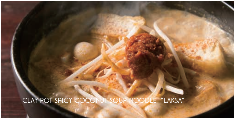
CLAY-POT SPICY COCONUT SOUP NOODLE "LAKSA"