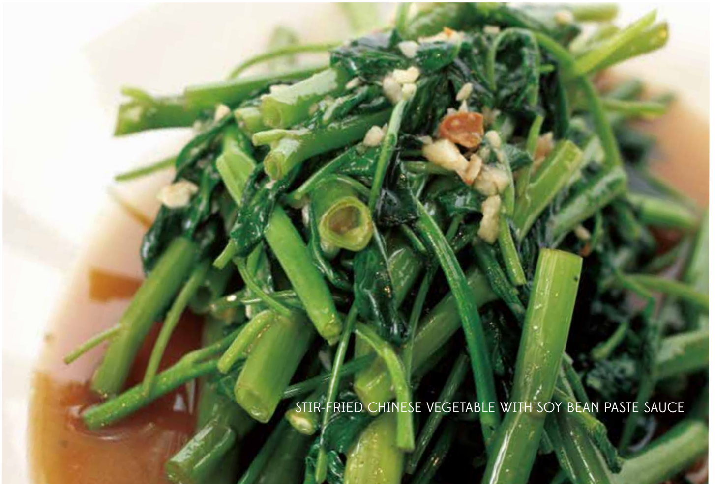
STIR-FRIED CHINESE VEGETABLE WITH SOY BEAN PASTE SAUCE