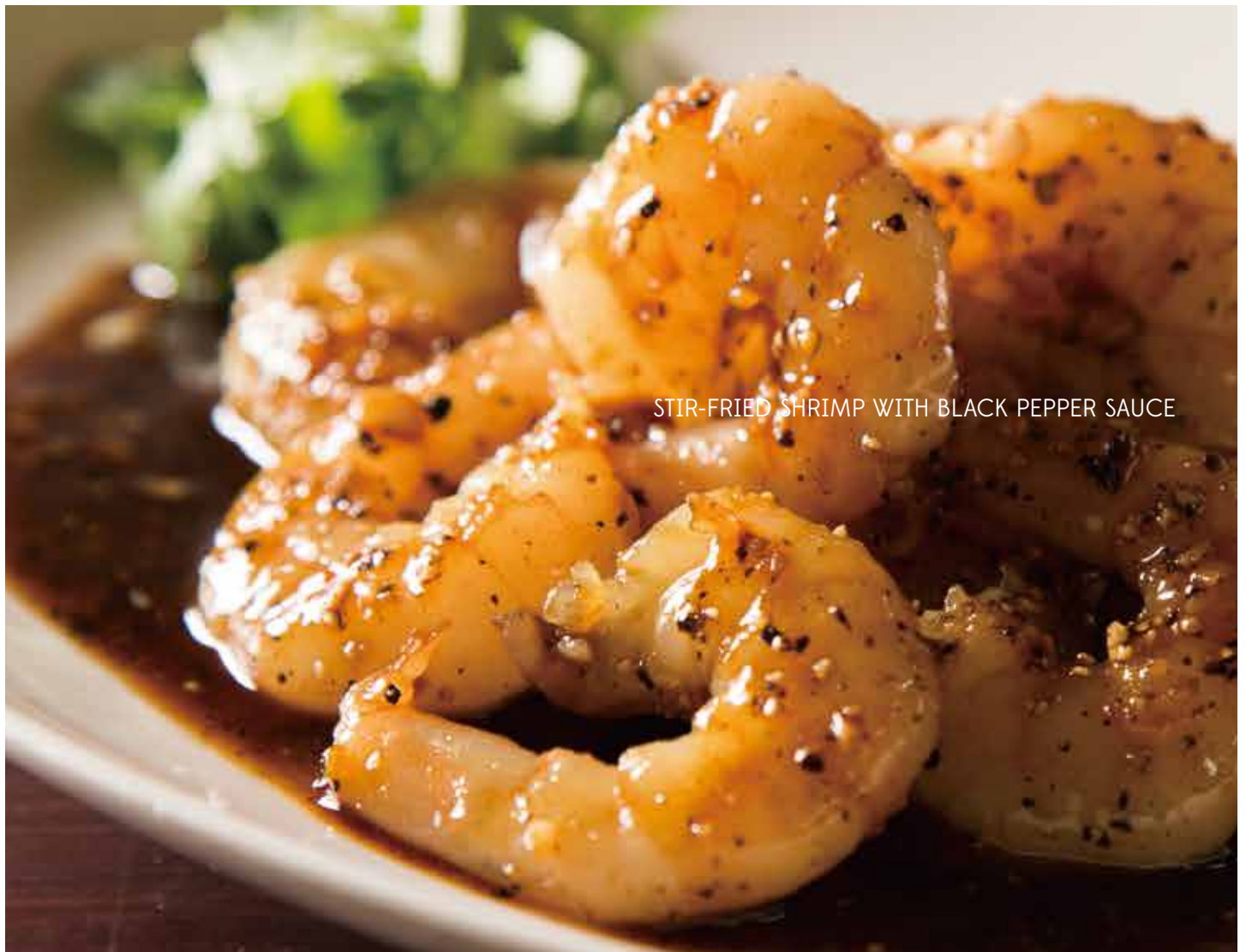
STIR-FRIED SHRIMP WITH BLACK PEPPER SAUCE