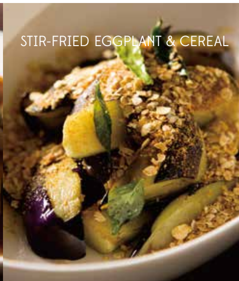
STIR-FRIED EGGPLANT & CEREAL