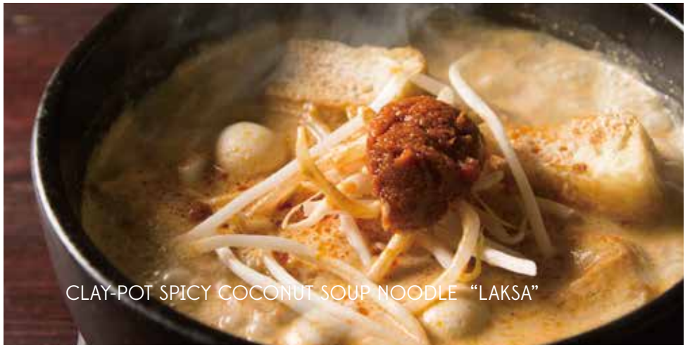
CLAY-POT SPICY COCONUT SOUP NOODLE "LAKSA"