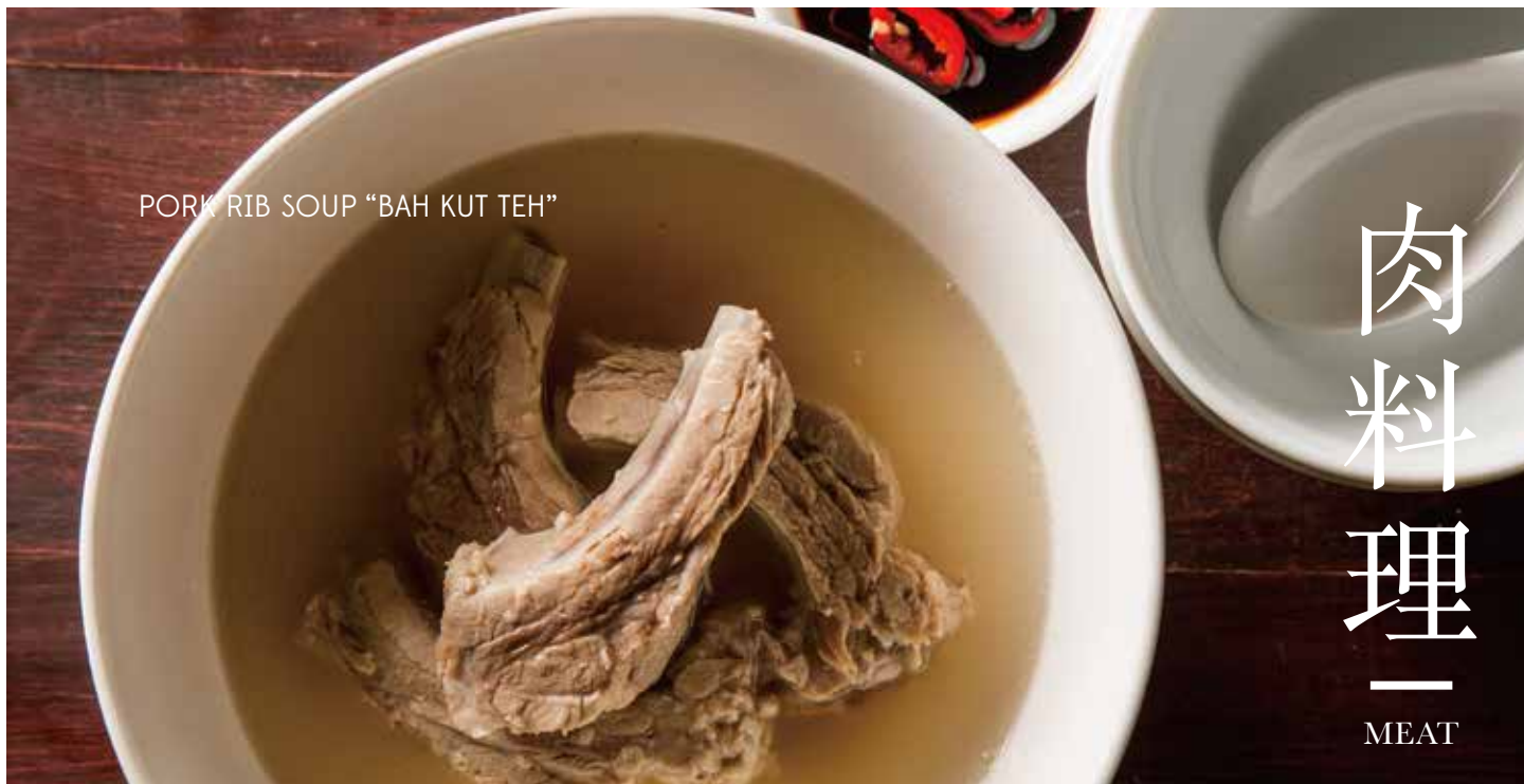
PORK RIB SOUP "BAH KUT TEH"