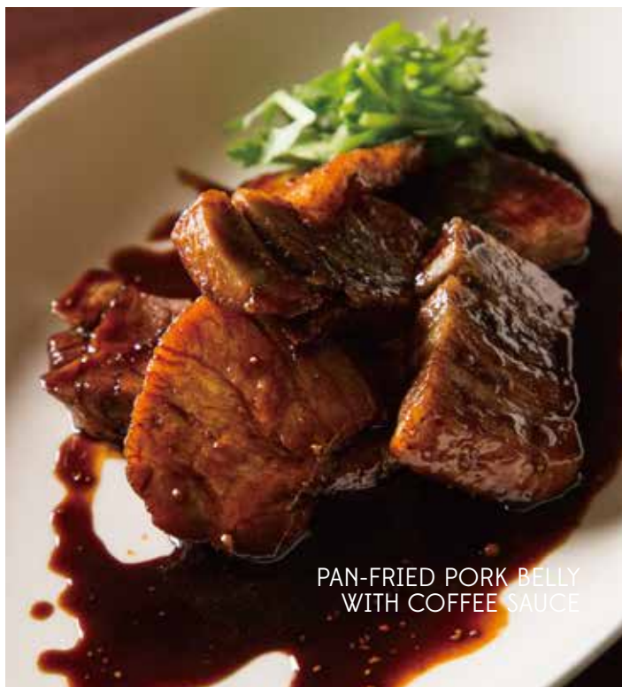
PAN-FRIED PORK BELLY WITH COFFEE SAUCE