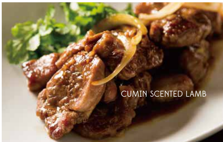
CUMIN SCENTED LAMB

ラムロースをバター醤油で薫り高くこっくりと炒めました。クミンが隠し味! (インドのスパイス+西洋のバター+中華系の醤油)