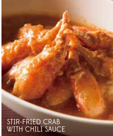
STIR-FRIED CRAB WITH CHILI SAUCE