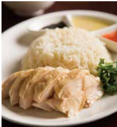
SINGAPORE CHICKEN RICE