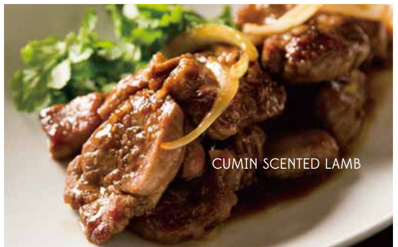
CUMIN SCENTED LAMB

ラムロースをバター醤油で薫り高くこっくりと炒めました。クミンが隠し味! (インドのスパイス+西洋のバター+中華系の醤油)