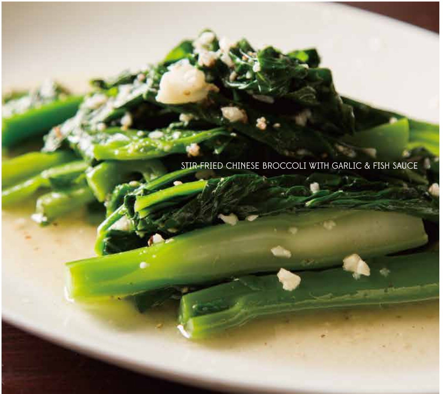
STIR-FRIED CHINESE BROCCOLI WITH GARLIC & FISH SAUCE