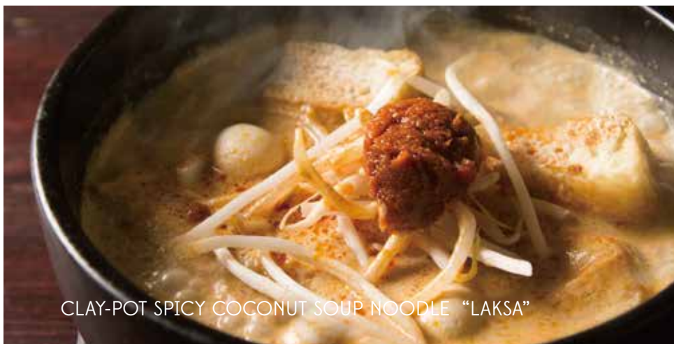
CLAY-POT SPICY COCONUT SOUP NOODLE "LAKSA"