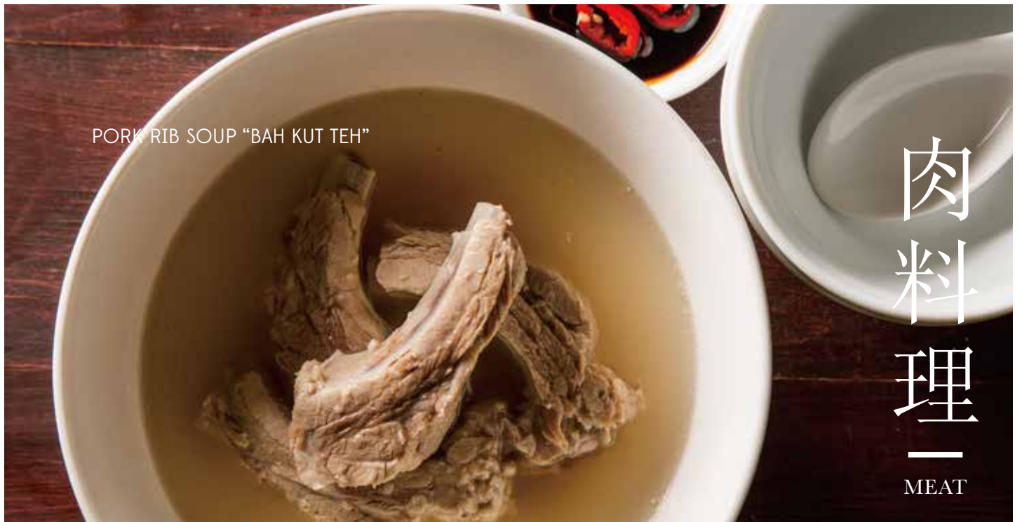
PORK RIB SOUP "BAH KUT TEH"